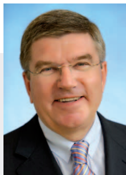
Dr. Thomas Bach Presidente de la Confederación Olímpica Alemana del Deporte

“Desde 1961 la promoción deportiva internacional forma parte integrante de la política cultural y educativa exterior de la República Federal de Alemania. La política exterior alemana apuesta por el diálogo entre las culturas. El deporte puede tender puentes, sobre todo en países en desarrollo y regiones en crisis. Practicar deporte significa aprender a aceptar reglas, respetar al contrario, celebrar juntos los éxitos y encajar las derrotas. El deporte enseña a asumir compromisos y dirimir conflictos de forma leal. La competición deportiva limpia genera confianza y comprensión recíproca. El deporte ayuda a erradicar prejuicios, integrar a las minorías y transmitir valores. De este modo el deporte contribuye a la prevención de crisis y al entendimiento entre los pueblos y propicia la compenetración por encima de las barreras lingüísticas, políticas y culturales. Esas son las razones por las cuales el Gobierno Federal promueve el deporte. Nuestra meta no es otra que contribuir a la solución pacífica de conflictos y fomentar el respeto de los derechos humanos en todo el mundo.”