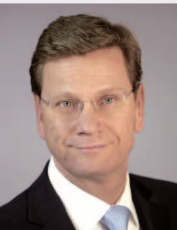
M. Guido Westerwelle Ministre fédéral des Affaires étrangères

« La promotion internationale du sport s'inscrit depuis 1961 dans la politique culturelle et éducative à l'étranger de la République fédérale d'Allemagne. La politique étrangère allemande mise sur le dialogue entre les cultures. Le sport peut créer des passerelles, notamment dans les pays en développement et les régions en crise.