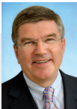
M. Thomas Bach Président de la Confédération olympique et sportive allemande

Faire du sport, c'est apprendre de manière ludique à accepter des règles, à respecter son adversaire, à fêter les victoires collectives et aussi à surmonter les défaites. Le sport enseigne comment passer des compromis et résoudre les conflits de manière juste. Une compétition sportive équitable nourrit la confiance et l'entente. Le sport aide à désamorcer les préjugés, à intégrer les minorités et à transmettre des valeurs. Il contribue ainsi à la prévention des crises et à l'amitié entre les peuples et crée des points de rencontre, au-delà des frontières linguistiques, politiques et culturelles. C'est pourquoi le gouvernement fédéral se démène pour le sport. Notre objectif est d'apporter une contribution à la résolution pacifique des conflits et de promouvoir le respect des droits de l'homme aux quatre coins du monde. »