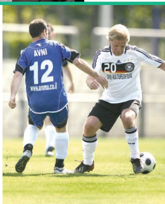
In der „Writers League“ spielt die Nationalmannschaft der Autoren gegen internationale Schriftstellerteams. Foto: Regisseur Sönke Wortmann im Spiel gegen Israel.