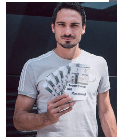
„Fest der Vielfalt“: Das Förderprojekt der Deutschen Soccer Liga verbindet Ball und Bildung.