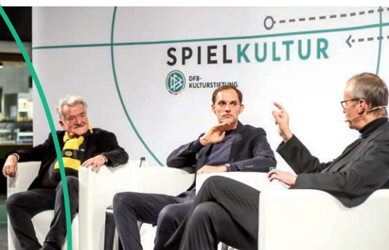
Thomas Tuchel und Stanford-Professor Hans Ulrich Gumbrecht bei einer Diskussion im Deutschen Fußballmuseum.

Die DFB-Kulturstiftung ist sowohl operativ als auch fördernd tätig. Seit ihrer Gründung 2007 hat sie mehr als 300 lokale und überregionale Projekte mit Zuwendungen von über drei Millionen Euro unterstützt. Ermöglicht wird dieses Engagement durch die regelmäßigen Benefizspiele der deutschen Nationalmannschaft und die Zuwendungen des Deutschen Fußball-Bundes.