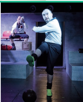
Das Theaterstück „Julier“ bringt das Leben und Leiden des deutsch-jüdischen Nationalspielers Julius Hirsch auf die Bühne.