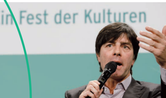
Auf der Frankfurter Buchmesse 2008 diskutiert Jogi Löw mit Künstlern und Autoren.

Und das mit manch überraschendem Ergebnis: Bundestrainer Joachim Löw diskutiert auf der Frankfurter Buchmesse. Umgekehrt schnürt ein ganz besonderes Team die Schuhe: Erst kicken, dann lesen – so das Motto der deutschen Autoren-Nationalmannschaft, die mit ihren Länderspielen mithilfe von Fußball und Literatur internationale Brücken baut und kulturelles Verständnis fördert.