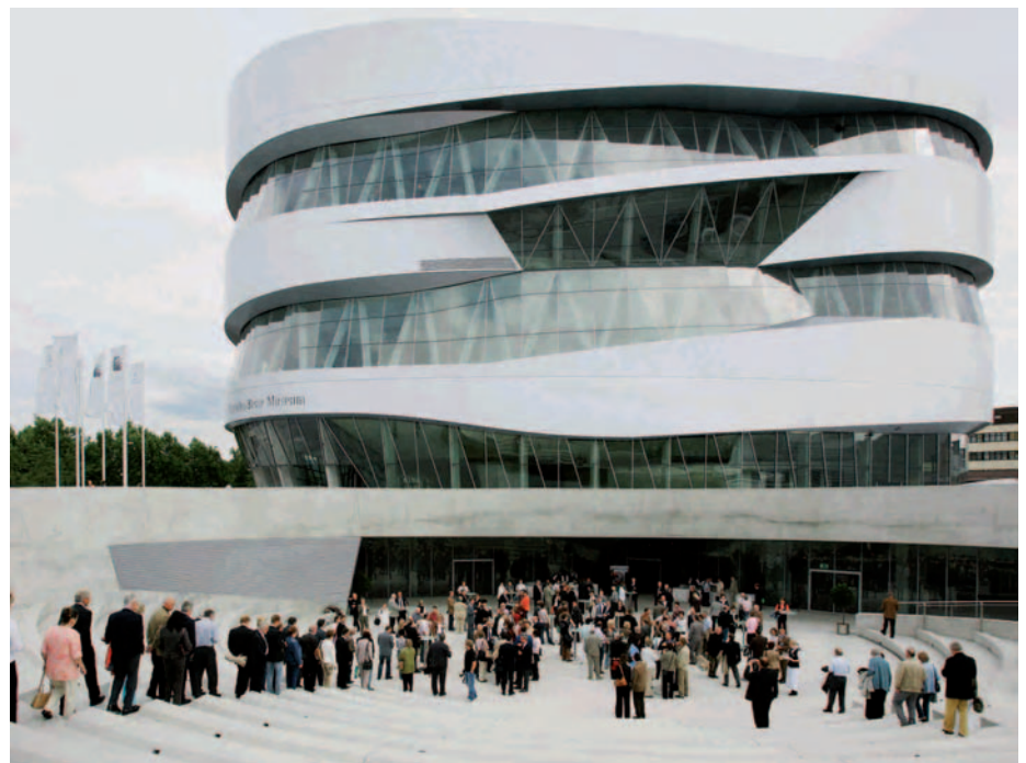
2006 in Stuttgart: Der Club 100 zu Gast im imposanten neuen Mercedes-Benz Museum

2004, wiederum in Leipzig, war das ‚Da Capo‘, ein Oldtimermuseum mit einer der größten Sammlungen amerikanischer Oldtimer, Ort der Festlichkeiten. Ein Jahr