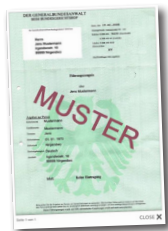
Das erweiterte Führungszeugnis - ein Baustein unter anderen

Seit dem 1. Mai 2010 kann in Deutschland ein sog. „erweitertes Führungszeugnis“ im Hinblick auf die Aufnahme einer ehrenamtlichen Tätigkeit durch das Bundesamt für Justiz ausgestellt und entweder online oder bei den Melde- oder Bürgerämtern der Städte und Kreise beantragt werden. Die Beantragung ist durch jede Person ab Vollendung des 14. Lebensjahres möglich. Das erweiterte Führungszeugnis gibt den Inhalt des Bundeszentralregisters wieder und beinhaltet zusätzlich zu den auch im „normalen Führungszeugnis“ enthaltenen Angaben Informationen zu rechtskräftigen Verurteilungen betreffend den Schutz Minderjähriger. Straftaten, die im erweiterten Führungszeugnis aufgeführt werden, sind beispielsweise der sexuelle Missbrauch Schutzbefohlener sowie der Besitz kinderpornographischen Materials. Das erweiterte Führungszeugnis enthält weder Einträge zu eingestellten Strafverfahren noch zu laufenden Ermittlungsverfahren. Nach Ablauf der Löschungsfrist tauchen alte Einträge nicht mehr auf. Das erweiterte Führungszeugnis wird zu Zwecken einer ehrenamtlichen Tätigkeit kostenlos ausgestellt. Ein vereinfachtes Verfahren, den Inhalt zu prüfen, ist z.B. das „Regensburger Modell“.