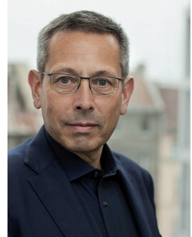
JOHANNES-WILHELM RÖRIG Unabhängiger Beauftragter für Fragen des sexuellen Kindesmissbrauchs

Der gelebte Schutz von Kindern und Jugendlichen vor sexualisierter Gewalt ist ein Qualitätsmerkmal für jeden Verein. In diesem Sinn wünsche ich Ihnen viel Erfolg bei Ihrer Arbeit – und unseren Kindern, dass sie sich beim Sport frei und unbeschwert entfalten können!